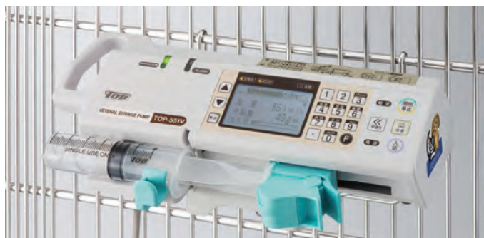
販売名: トップ動物用シリンジポンプ TOP-551V 医療機器承認番号: 23 動薬第 240 号