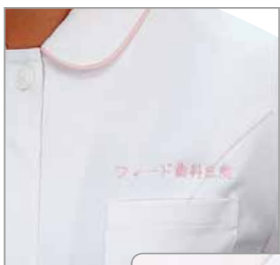
「フィード歯科医院」 字体:E+A 色:ピンク