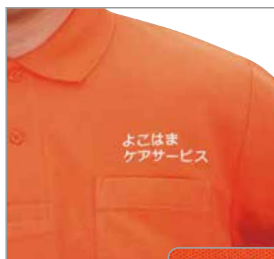
「よこはま ケアサービス」 字体:D+F 色:ホワイト