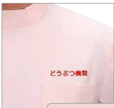
「どうぶつ病院」 字体:D+B 色:レッド