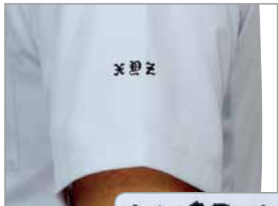
「XYZ」 字体:I 色:ダークブルー

袖口への刺繍も可能です。写真はイメージサンプルのため、字体や色については右ページよりお選びください。