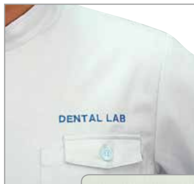
「DENTAL LAB」 字体:H 色:ブルー