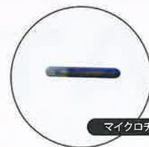
マイクロチップ実寸大